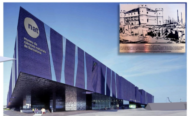
Museu de Ciències Naturals de Barcelona (Museu Blau)

Dia 29 de Novembre a les 11 h, a l'aula Polivalent (Edifici A) de la EEBE