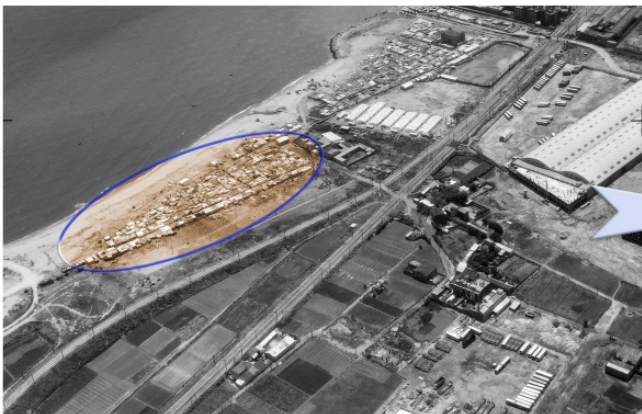
Camp de la Bota, 1960

Cita escollida per J.M. Monferrer en el llibre “El pla de transformació de la Mina 2000-2015”