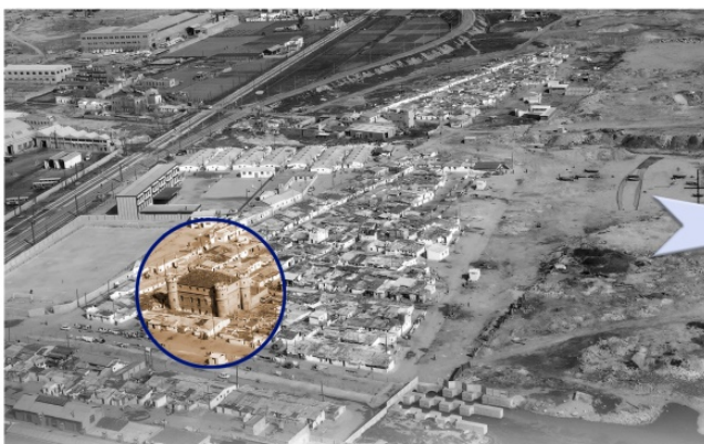
Camp de la Bota, 1972